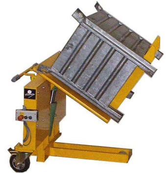
TSK – handhydr. TSKE – elektrohydr