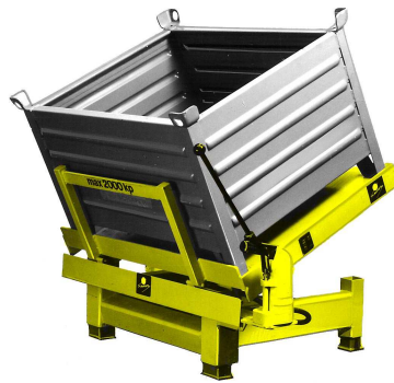
NHH – handhydr. NHE – elektrohydr.